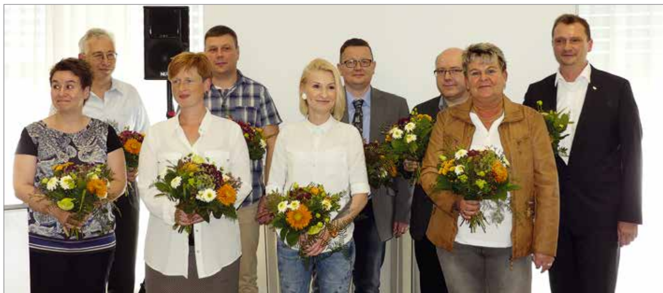
Der neue Landesvorstand des BSBD Sachsen.