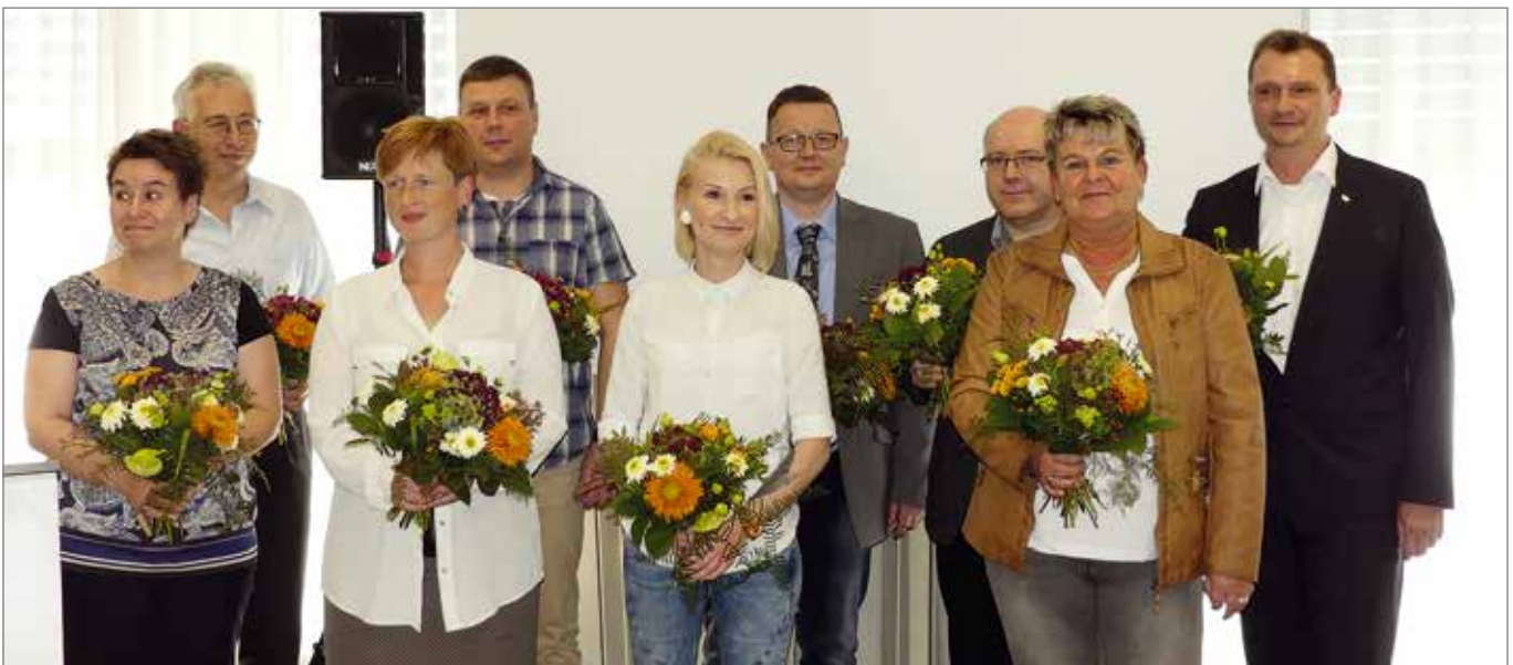
Der neue Landesvorstand des BSBD Sachsen.