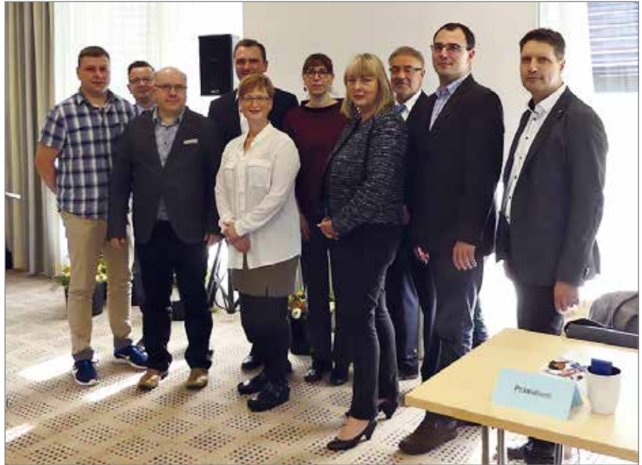
Landesleitung mit Gästen.