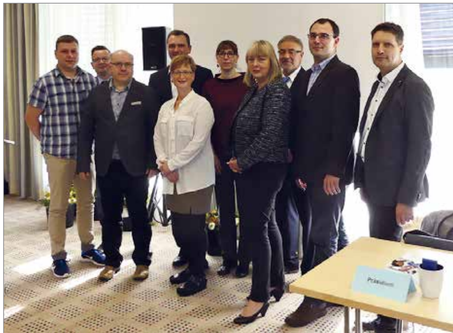
Landesleitung mit Gästen.