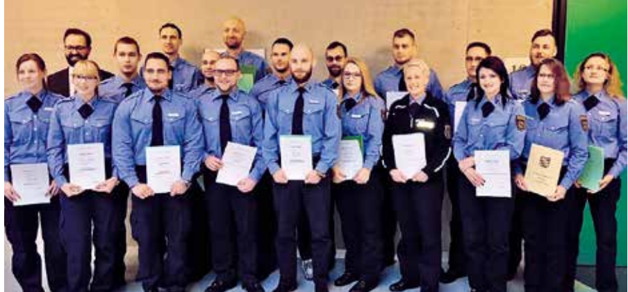
Die erfolgreichen Absolventen mit Staatsminister der Justiz Sebastian Gemkow.