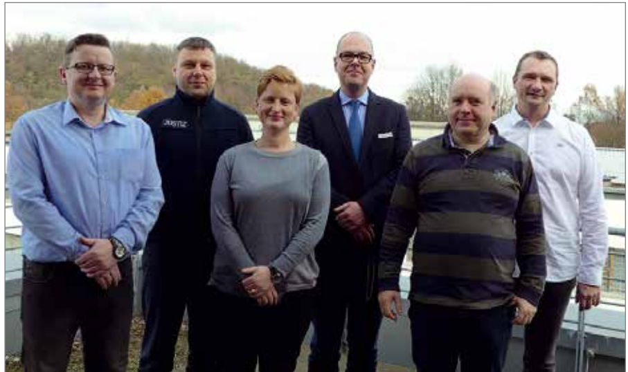
In der konstituierenden Sitzung der BSBD-Landesleitung wurden die Aufgaben für die kommenden fünf Jahre vergeben.

in den nächsten fünf Jahren weiter dafür kämpfen, dass der Justizvollzug in der Politik wieder wahr- und ernstgenommen wird, und sich die Arbeitsbedingungen aller Mitarbeiter verbessern.